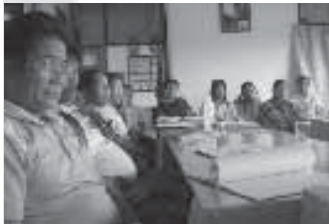
msประชุมประจำเดือนของอ.ส.ม.ก่อนบัย