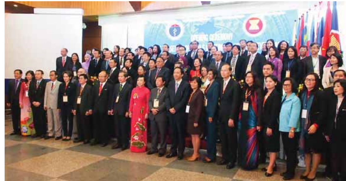
การจัดประชุมต่อที่ประชุมเจ้าหน้าที่อาวุโสด้านการพัฒนาสาธารณสุขกลุ่มประเทศอาเซียน ครั้งที่ 10 (The 10th ASEAN SOMHD) เมื่อวันที่ 14 - 16 กันยายน พ.ศ. 2558 ณ เมืองดาลัด จังหวัดเลิมดง สาธารณรัฐสังคมนิยมเวียดนาม

พร้อมกันนี้ได้รายงานความคืบหน้าการเตรียมความพร้อมการจัดประชุมต่อที่ประชุมเจ้าหน้าที่อาวุโสด้านการพัฒนาสาธารณสุขกลุ่มประเทศอาเซียน ครั้งที่ 10 (The 10th ASEAN SOMHD) เมื่อวันที่ 14 - 16 กันยายน พ.ศ. 2558 ณ เมืองดาลัด จังหวัดเลิมดง สาธารณรัฐสังคมนิยมเวียดนาม โดยที่ประชุมมีมติรับทราบพร้อมให้รายงานผลการประชุมต่อที่ประชุมเจ้าหน้าที่อาวุโสด้านการพัฒนาสาธารณสุขกลุ่มประเทศอาเซียน ครั้งที่ 11 ในปี พ.ศ.2559 ณ เนการาบรูไนดารุสซาลาม ต่อไป