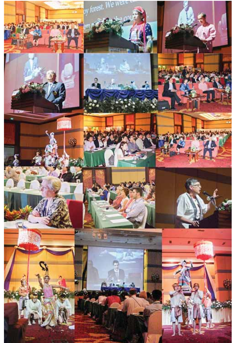
การประชุมมหานาชาติการประเมินผลกระทบด้านสุขภาพภาคพื้นเอเชียแปซิฟิก พ.ศ. 2551 ที่จัดขึ้นระหว่างวันที่ 22-24 เมษายน พ.ศ. 2552 ณ จังหวัดเชียงใหม่ ประเทศไทย

ต่อมาที่ประชุมเจ้าหน้าที่อาวุโสด้านการพัฒนาสาธารณสุขกลุ่มประเทศอาเซียน (ASEAN SOMHD) ครั้งที่ 6 ณ เมืองเนปิดอว์ สาธารณรัฐแห่งสหภาพเมียนมาร์ เมื่อปี พ.ศ. 2554 ได้มอบหมายให้ประเทศไทยเป็นเจ้าภาพหลักพัฒนาการประเมินผลกระทบด้านสุขภาพหรือเอชไอเอในภูมิภาคนี้ พร้อมกับจัดประชุมเชิงปฏิบัติการเพื่อทำความเข้าใจกับผู้ประสานงานหลักเรื่องเอชไอเอในภูมิภาคอาเซียน