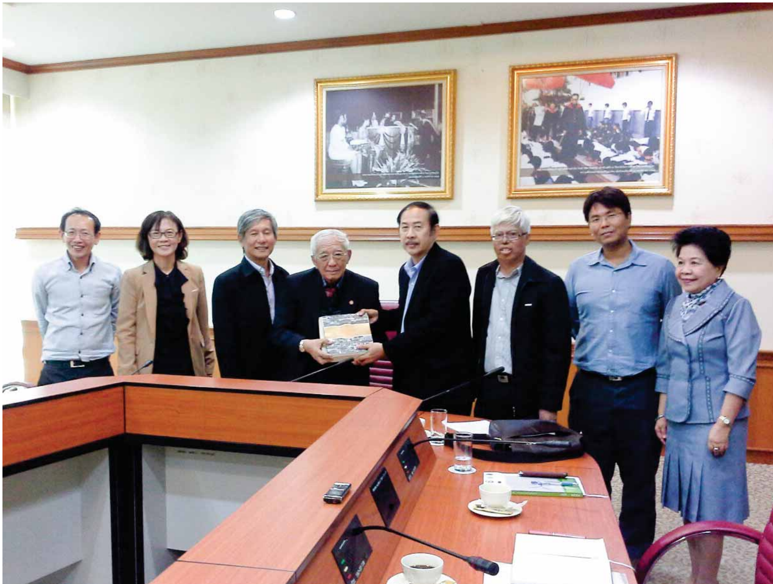
เมื่อวันที่ 9 มกราคม พ.ศ. 2558 ได้มีการประชุมร่วมกันระหว่างสำนักงานคณะกรรมการสุขภาพแห่งชาติ (สช.) และ มหาวิทยาลัยนครสวรรค์ (มท.) เพื่อเตรียมการจัดประชุมวิชาการนานาชาติฯ ณ มหาวิทยาลัยนครสวรรค์ จังหวัดพิจิตร