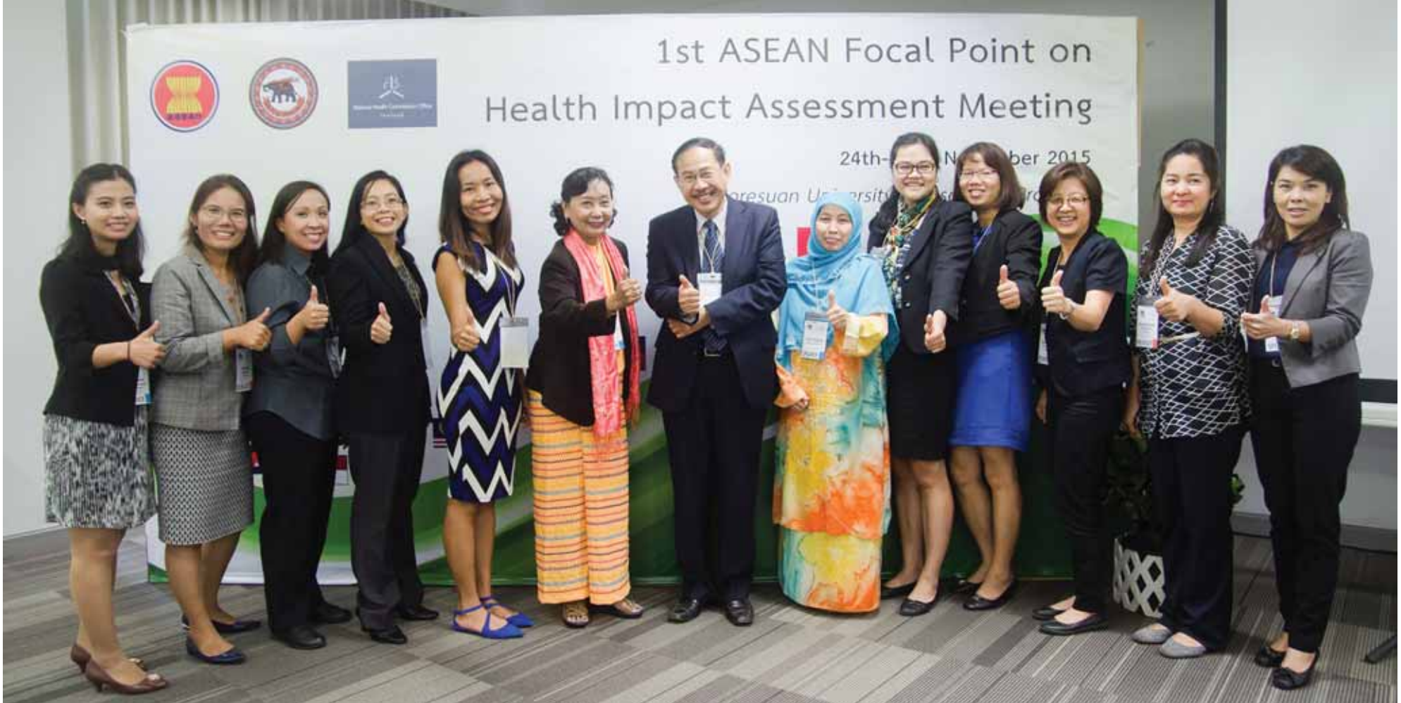
The 1st ASEAN Focal Point on HIA (AFPPIA) meeting ระหว่างวันที่ 24 - 25 พฤศจิกายน พ.ศ. 2558 ณ มหาวิทยาลัยนเรศวร จังหวัดพิษณุโลก ประเทศไทย

การประชุมดังกล่าวมีภาคีเครือข่ายทุกภาคส่วนทั้งไทยและต่างประเทศเข้าร่วม เช่น ผู้ว่าราชการจังหวัดพิษณุโลก การท่องเที่ยวแห่งประเทศไทย จังหวัดพิษณุโลก ผู้แทนจากกระทรวงสาธารณสุข กระทรวงสิ่งแวดล้อมในภูมิภาคอาเซียน ผู้แทนจากคณะสาธารณสุขศาสตร์จากมหาวิทยาลัยในกลุ่มประเทศลุ่มแม่น้ำโขง สำนักงานกองทุนสนับสนุนการส่งเสริมสุขภาพ (สสส.) เครือข่ายโรคภัยไข้เจ็บ ผู้แทนจากองค์การระหว่างประเทศ เช่น องค์การอนามัยโลก (WHO) องค์การพัฒนาระหว่างประเทศ (UNDP) ธนาคารพัฒนาเอเชีย (ADB) บริษัทเงินทุนระหว่างประเทศ (IFC) องค์การกรีนพีซระหว่างประเทศ องค์การ PACT เครือข่าย The Asian Environment Compliance and Enforcement Network (AECEN) ศูนย์วิจัยและฝึกอบรมเพื่อยกระดับคุณภาพชีวิตของคนวัยทำงาน มหาวิทยาลัยขอนแก่น (REQW: Research and Training