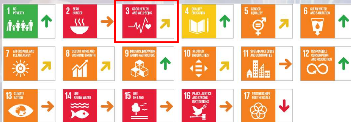
ภาพรวมเป้าหมายที่ 3

■ Major challenges ■ Significant challenges ■ Challenges remain ■ SDG achieved ↓ Decreasing → Stagnating ↗ Moderately improving ↑ On track or maintaining SDG achievement ● Information unavailable