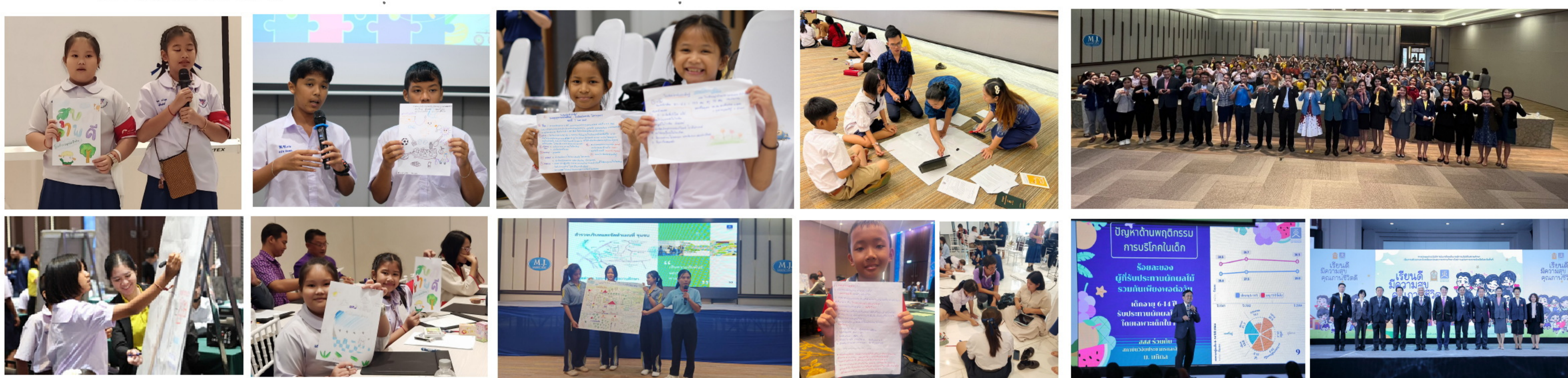
การเสริมศักยภาพแก่นำสถานศึกษา นำร่องในการพัฒนาระบบสุขภาพสถานศึกษา ด้วยกระบวนการและเครื่องมือธรรมนูญสุขภาพสถานศึกษา