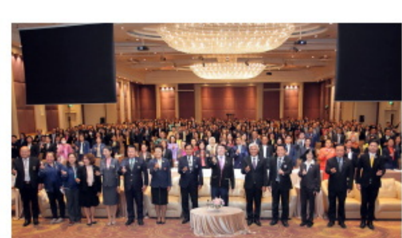
พิธีลงนามบันทึกข้อตกลงความร่วมมือ “การขับเคลื่อนธรรมนูญสุขภาพสถานศึกษา” ระหว่างกระทรวงศึกษาธิการ และสำนักงานคณะกรรมการสุขภาพแห่งชาติ เมื่อวันที่ 17 กรกฎาคม พ.ศ. 2566 ณ กระทรวงศึกษาธิการ