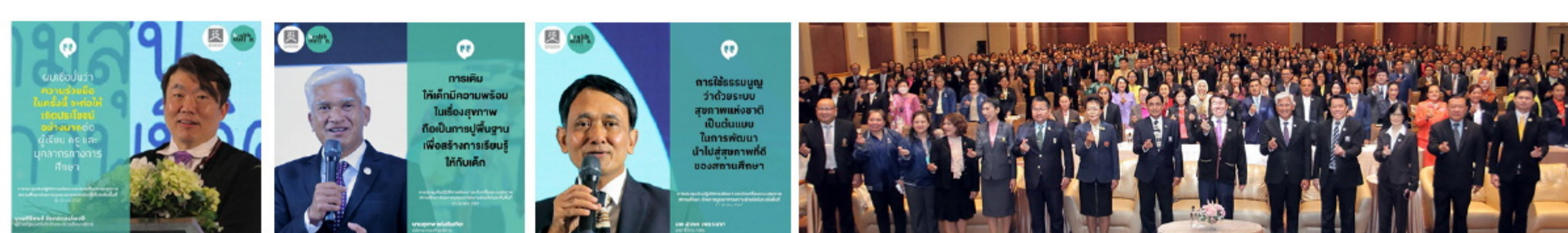
การมอบนโยบายการพัฒนาและขับเคลื่อนระบบสุขภาพของสถานศึกษาและการประชุมปฏิบัติการพัฒนาและขับเคลื่อนระบบสุขภาพสถานศึกษาด้วยการบูรณาการความร่วมมือในระดับพื้นที่: เรียนดี มีความสุข คุณภาพชีวิตดี โดยความร่วมมือของกระทรวงศึกษาธิการ และ สส. ระหว่างวันที่ 21-22 มีนาคม พ.ศ. 2567