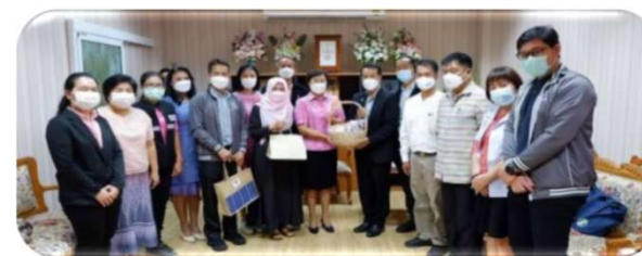
พบผู้ว่าราชการจังหวัดหนองบัวลำภู ๑๕ มีนาคม ๒๕๖๕