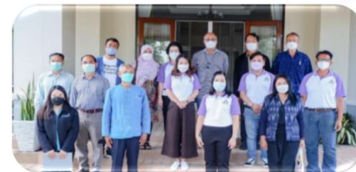
พบผู้ว่าราชการจังหวัดเลย ๒๙ มกราคม ๒๕๖๕