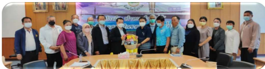
พบผู้ว่าราชการจังหวัดมิ่งกาฬ ๓ มีนาคม ๒๕๖๕