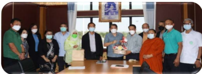
พบผู้ว่าราชการจังหวัดหนองคาย ๙ กุมภาพันธ์ ๒๕๖๕