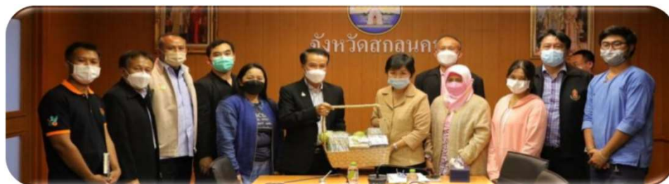
พบผู้ว่าราชการจังหวัดสกลนคร ๒๒ กุมภาพันธ์ ๒๕๖๕