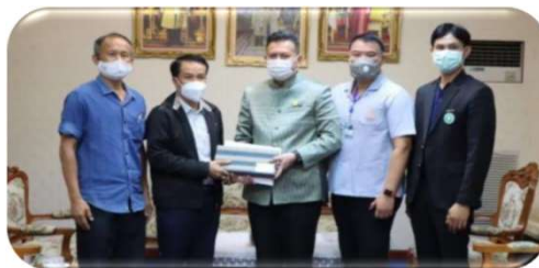
พบผู้ว่าราชการจังหวัดนครพนม ๗ มกราคม ๒๕๖๕