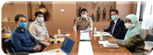
พบผู้ว่าราชการจังหวัดอุดรธานี ๑ มีนาคม ๒๕๖๔